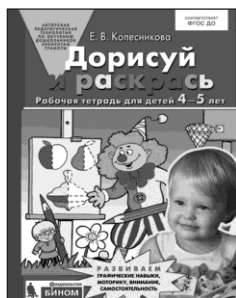
«Дорисуй и раскрась». Рабочая тетрадь для детей 4-5 лет