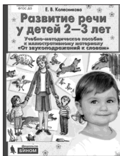
«Развитие речи у детей 2–3 лет». Учебно-методическое пособие к иллюстративному материалу «От звукоподражаний к словам»