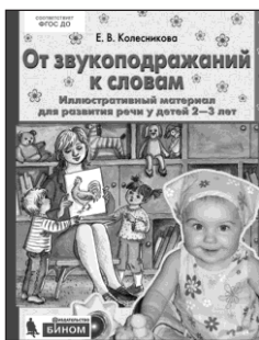
«От звукоподражаний к словам». Иллюстративный материал для развития речи у детей 2-3 лет