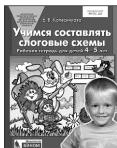
«Учимся составлять слоговые схемы». Рабочая тетрадь для детей 4–5 лет

Используйте данные пособия только после того, как закончите обучение детей по книгам основного комплекта.