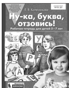
«Ну-ка, буква, отзовись!» Рабочая тетрадь для детей 5–7 лет