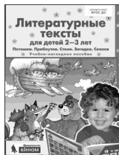
«Литературные тексты для детей 2–3 лет». Учебно-наглядное пособие