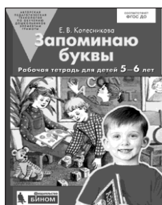
«Запоминаю буквы». Рабочая тетрадь для детей 5–6 лет