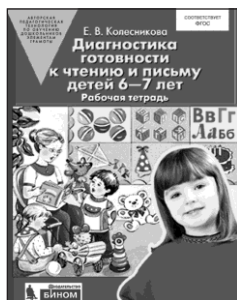
«Диагностика готовности к чтению и письму детей 6–7 лет». Рабочая тетрадь