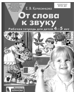
«От слова к звуку». Рабочая тетрадь для детей 4-5 лет