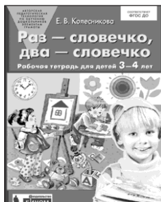
«Раз — словечко, два — словечко». Рабочая тетрадь для детей 3-4 лет