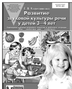
«Развитие звуковой культуры речи у детей 3–4 лет». Учебно-методическое пособие