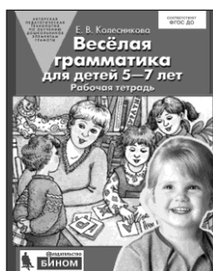
«Веселая грамматика для детей 5–7 лет». Рабочая тетрадь