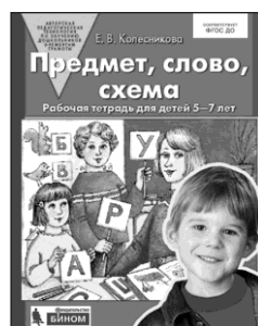
«Предмет, слово, схема». Рабочая тетрадь для детей 5–7 лет