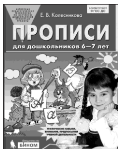
«Прописи для дошкольников 6–7 лет»