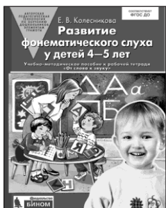
«Развитие фонематического слуха у детей 4–5 лет». Учебно-методическое пособие