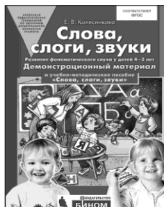
«Слова, слоги, звуки». Демонстрационный материал для занятий с детьми 4-5 лет